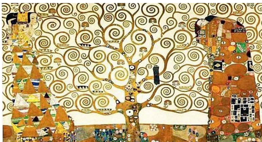
Γκούσταφ Κλιμτ - "Το δέντρο της ζωής" (1909)