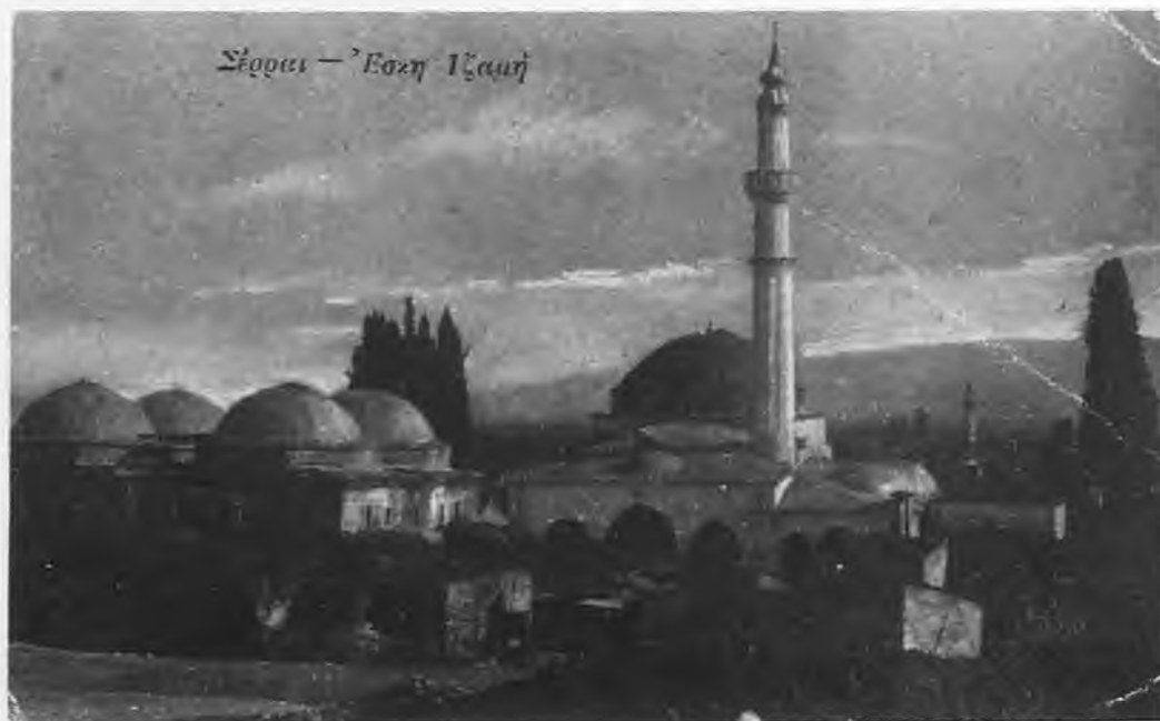
Εικ. 25. Το Ατίκ ή Εσκή Τζαμί. Κτίστηκε το 1385. Η Εφορεία του ωδείου διαπραγματευόταν το 1935 την απευθείας εξαγορά του από την Εθνική Τράπεζα που αν πραγματοποιούνταν τελικά, το ωδείο θα έσωζε αυτό το κομψοτέχνημα -κατεδαφίστηκε το 1938- και ίσως στις μέρες μας θα χρησιμοποιούνταν σαν μουσικό διδακτήριο κι ακόμα για τη στέγαση του μουσικού μουσείου της πόλης.