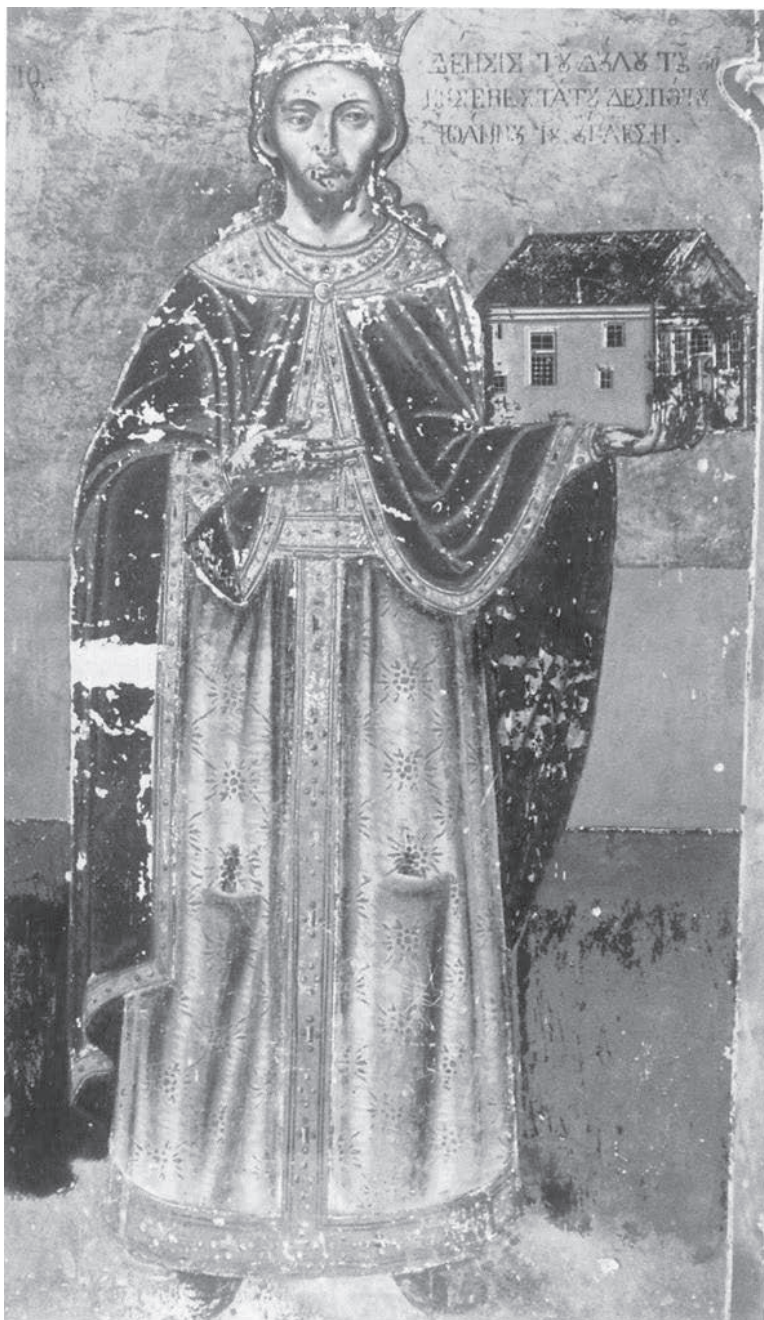
Ο δεσπότης Ούγκλεσης. Τοιχογραφία στην εκκλησία των Αγίων Αναργύρων στο Βατοπέδι. Γύρω στο 1370, με επιζωγράφιση του 19 ου αιώνα. Διασώζει την επιγραφή: «Δέησις του δούλου του Θεού ευσεβεστάτου δεσπότη Ιωάννου του Ούγκλεση»