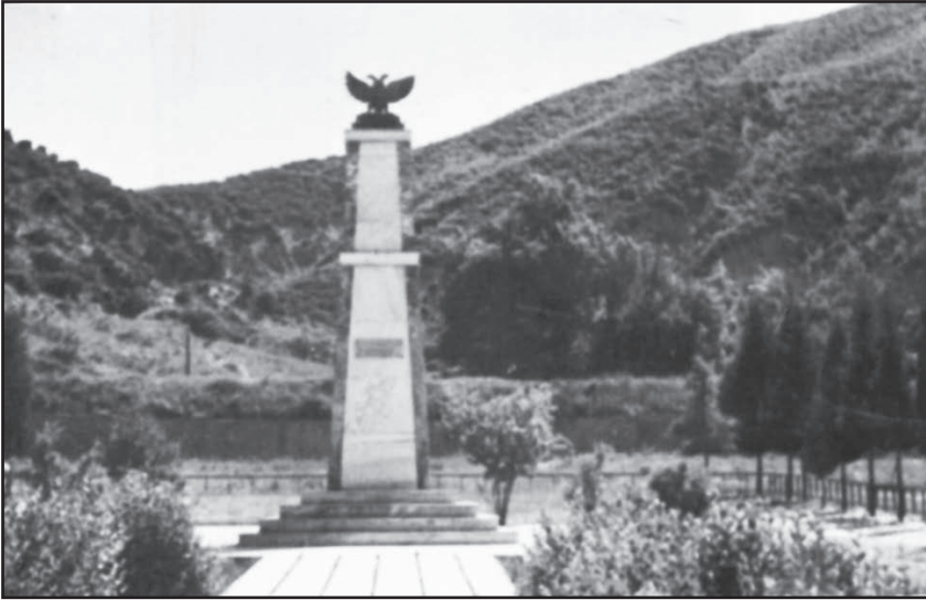
Το μνημείο του Βασιλείου Β' Βουλγαροκτόνου στην τοποθεσία Κλειδί

Το γεγονός προκαλεί πολύ κακή εντύπωση διότι εφαρμόστηκε σε πολλούς ανθρώπους. Δεν εφαρμόστηκαν όμως ανάλογα μέτρα και κατά την αρχαία και νεότερη ιστορία; Από τους αρχαίους αναφέρεται η σφαγή των Μυτιληναίων και από τους νεότερους η σφαγή των καθολικών Ιρλανδών. Η πράξη του Βασιλείου έγινε χωρίς δίκη, χωρίς συζήτηση, μέσα στα πλαίσια της αγριότητας ενός μακρού καταστρεπτικού πεισματώδους πολέμου 40 ετών ζωής και θανάτου. Όπως δείχνει η ιστορία, συνέβησαν πολλές φορές και χειρότερα κατόπιν μακράς δίκης, πολλών συζητήσεων και ήρεμης αποφάσεως σε πολλά κράτη σε