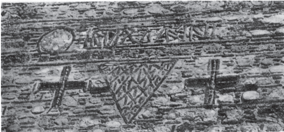
Επιγραφή του πύργου της Ακροπόλεως Σερρών

Πριν τον 6 ο αιώνα μ.Χ. δεν υπήρχε ούτε ίχνος σλαβικής φυλής και γλώσσας στα Βαλκάνια. Οι πρόγονοι των σημερινών Σλάβων ζούσαν πριν τον 6 ο αιώνα στις στέπες της Λευκής Ρωσίας και της ανατολικής Πολωνίας. Από τον 6 ο αιώνα μ.Χ. άρχισαν να κατέρχονται νοτιότερα προς εξεύρεση τροφής, κάνοντας