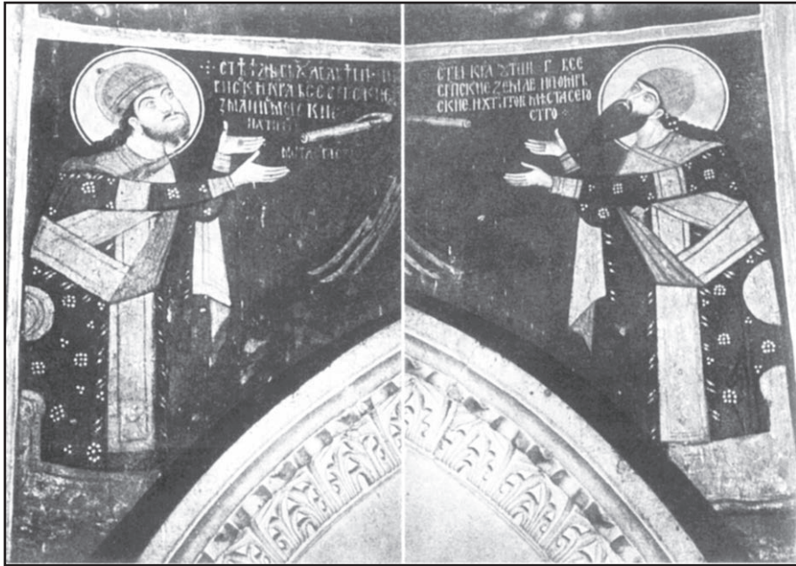
Ο κράλης Στέφανος Δουσάν (1308-1355) και ο πατέρας του, κράλης Στέφανος Ντετσάνσκι. Τοιχογραφία στο σερβικό μοναστήρι της Ντέτσιανης, πάνω από την είσοδο του νάρθηκα. Γύρω στο 1330.

στον Καντακουζηνό. Προσπάθησε να τους πείσει με το καλό επί τρεις ημέρες, αλλά αρνούσαν να του την παραδώσουν.