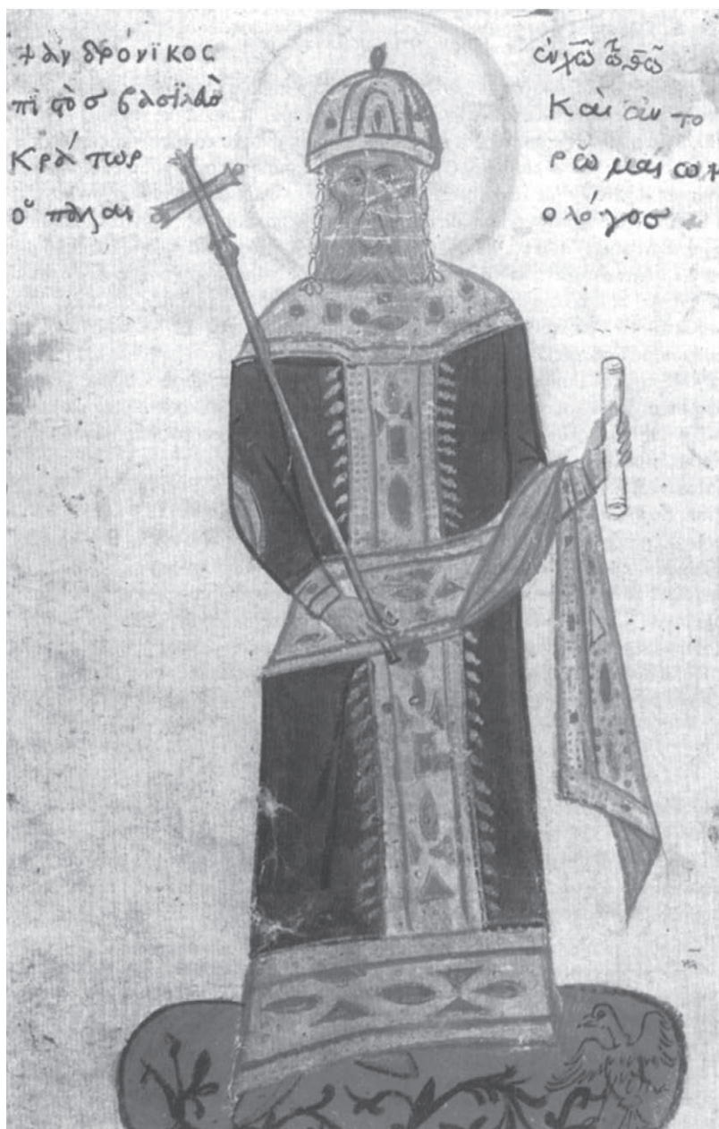
Ο αυτοκράτορας Ανδρόνικος Β΄ Παλαιολόγος (1282-1328). Μικρογραφία από τη Χρονογραφία του Γ. Παχυμέρη (Μόναχο, Βαυαρική Κρατική Βιβλιοθήκη)

Στην πρώτη φάση, κατέληξαν σε συμφωνία να τον διαδεχθεί ο εγγονός του στο θρόνο χωρίς πολεμικές επιχειρήσεις. Ανέλαβε τη διοίκηση της Ανατολικής Θράκης από τη Σηλυμβρία μέχρι τη Χριστούπολη με πρωτεύουσα την Αδρια-