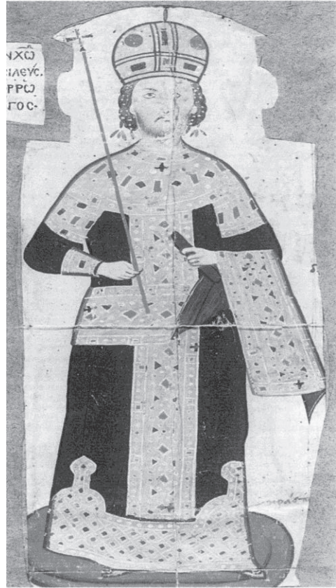
Ο Ανδρόνικος Γ΄ Παλαιολόγος (1328-1341), σε μικρογραφία του 14 ου αιώνα (Στουτγκάρδη, Κρατική Βιβλιοθήκη Βυρτεμβέργης)

Ο Ανδρόνικος Γ΄ στις 26 Αυγούστου 1334 μπήκε με το στρατό του στη Θεσσαλονίκη και έκανε συνθήκη ειρήνης με τον Δουσάν. Οι Σέρβοι τότε κινδύνευαν από τους Ούγγρους. Διήρκεσε η ειρήνη μέχρι την ημέρα του θανάτου του Ανδρόνικου Γ΄ στις 15 Ιουνίου 1341. Σε ηλικία 44 ετών πέθανε ο Ανδρόνικος Γ΄ και άφησε στο θρόνο το δεκάχρονο υιό του Ιωάννη Ε΄ Παλαιολόγο με πολλούς μνηστήρες της αντιβασιλείας. Οι σπουδαιότεροι μεταξύ αυτών ήταν: α) ο δομέστικος Ιωάννης Καντακουζηνός, παιδικός φίλος του αυτοκράτορα Ανδρόνικου Γ΄, β) ο μεγάλος δούκας Αλέξιος Απόκαυκος, γ) η μητέρα του ανήλικου αυτοκράτορα Άννα της Σαβοΐας και δ) ο πατριάρχης Ιωάννης Καλέκας. Ο Καντακουζηνός με δικά του έξοδα έκανε πολυτελέστατη κηδεία στο φίλο του αυτοκράτορα Ανδρόνικο Γ΄, όταν αυτός πέθανε, και με δικό του μισθοφορικό στρατό προσπαθούσε να διώξει τους Τούρκους που λεηλατούσαν τη Θράκη.