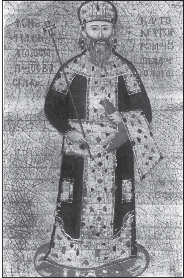
Ο Μανουήλ Β΄ Παλαιολόγος σε μικρογραφία χειρογράφου 'Επιταφίου', που συνέταξε ο ίδιος για να τιμήσει τη μνήμη του αδελφού του Θεοδώρου, δεσπότη του Μορέως (Παρίσι, Εθνική Βιβλιοθήκη)

Οι ελάχιστοι Σέρβοι που έμειναν στις Σέρρες δέχθηκαν τη συνεργασία του Μανουήλ Β΄. Η πόλη των Σερρών ξαναγύρισε στους βυζαντινούς χωρίς πολιορκία και αιματοχυσία. Δεν επέφερε αλλαγές στις Σέρρες ο Μανουήλ ως προς τη διοίκηση, διότι όλοι προτιμούσαν την ελληνική αποκατάσταση από την τουρκική κατοχή. Ανακαταλαμβάνοντας τις Σέρρες από τους Σέρβους φρόντισε να οχυρώσει τα επικίνδυνα σημεία της Ακροπόλεως στη βόρεια πλευρά,